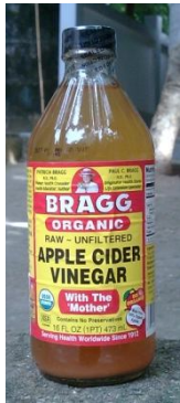
น้ำส้มสายชูหมักจากแอปเปิ้ล หรือ apple cider vinegar นำเข้าจากต่างประเทศ ขวดละ 320 บาท

การผลิตน้ำส้มสายชูหมัก เป็นการหมัก สองขั้นตอน คือ การหมักน้ำตาล ให้เกิดแอลกอฮอล์โดยใช้ยีสต์ ตามด้วยการหมักแอลกอฮอล์ให้เกิดกรดอะซิติกด้วยแบคทีเรียใน