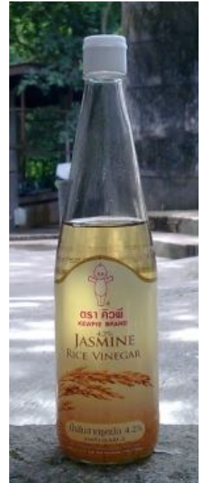
น้ำส้มสายชูหมักจากข้าว ตรา คิวพี ผลิตในประเทศไทย ขวดละ 40 บาท

เป็นกรดอ่อนมีความเข้มข้นประมาณ 95% มาเจือจางจนได้ปริมาณกรด 4 - 7% ลักษณะใส ไม่มีสี