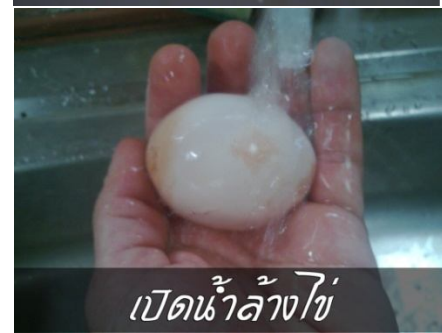
เปิดน้ำล้างไข่