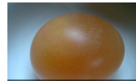
ล้างดูเปลือกออกหมดแล้ว