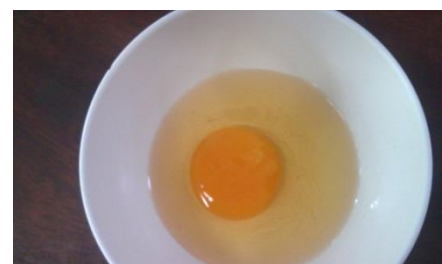
ไข่ที่เอาเยื่อหุ้มออกแล้ว